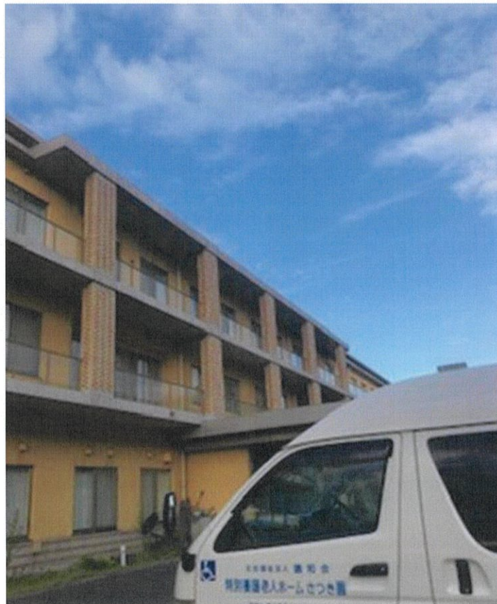
千葉県木更津市長須賀1219番地 電話 0438-23-2555